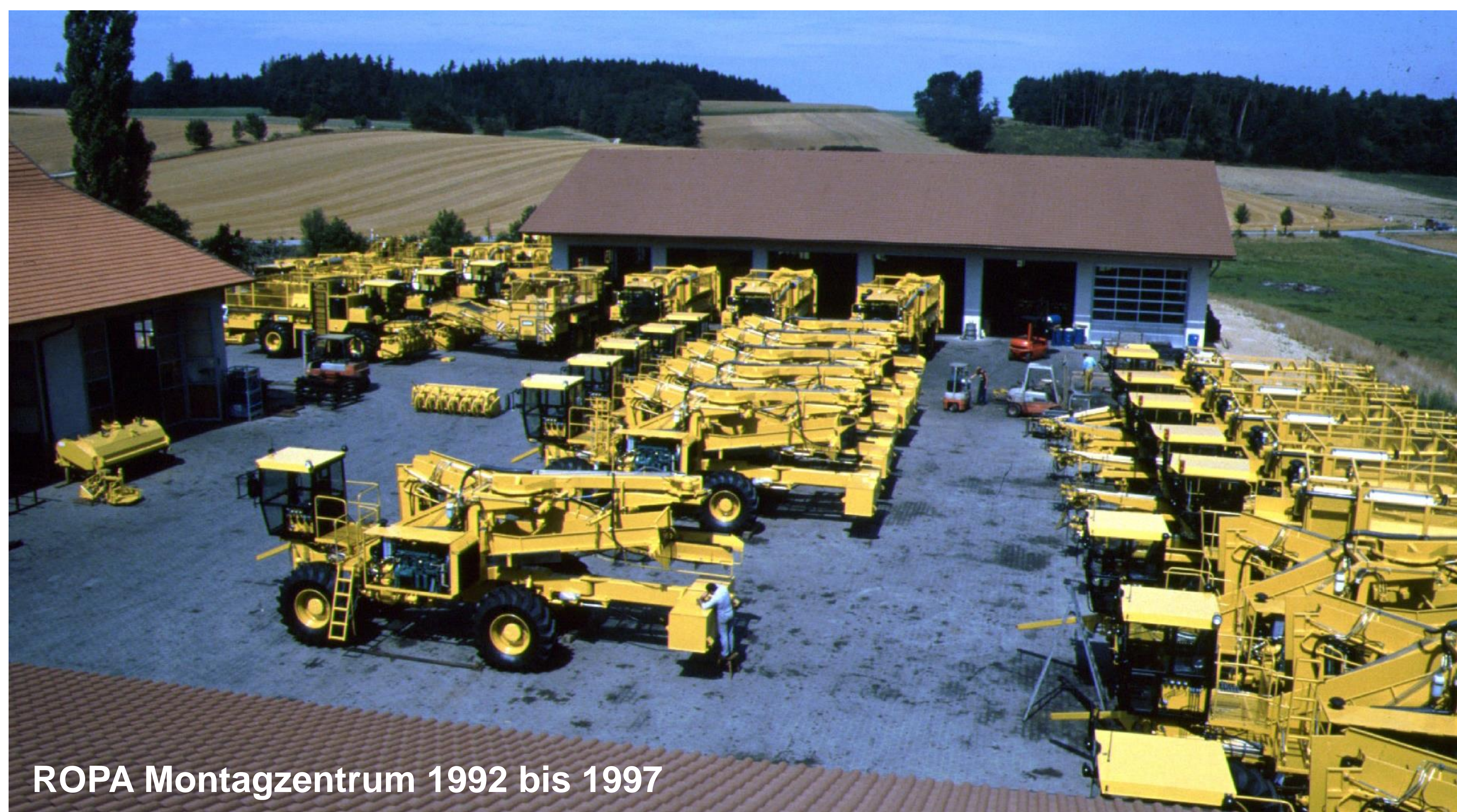
ROPA Montagzentrum 1992 bis 1997